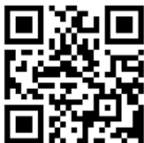
VIDEO DE MONTAJE / MOUNTING VIDEO

CONSULTAR EN NUESTRA PAGINA WEB LA DISPONIBILIDAD DEL VIDEO DE MONTAJE DE ESTA REFERENCIA. CONSULT OUR WEBSITE THE VIDEO MOUNT AVAILABILITY OF THIS REFERENCE.